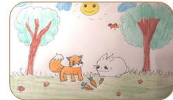
Tóth Boglárka (7. b)