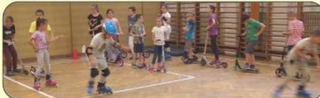
ROLLER- és GÖRKORCSOLYVERSENY