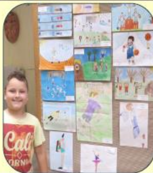
„A SPORT ÉS ÉN” rajzpályázat