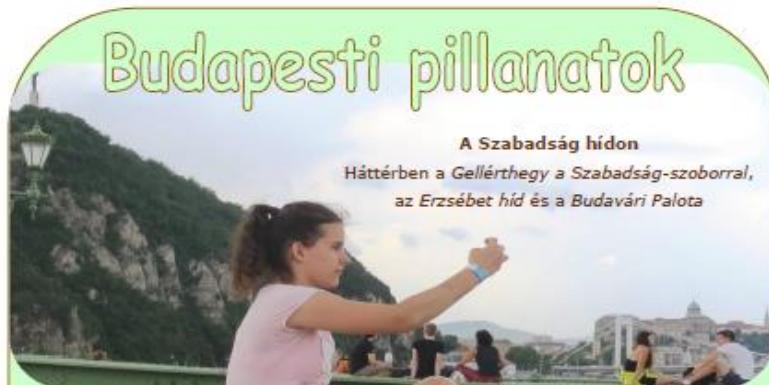
A Szabadság hídon

Háttérben a Gellérthegy a Szabadság-szoborral, az Erzsébet híd és a Budavári Palota