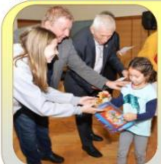
A rajzpályázat egyik nyertese