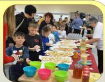
Riporter: Németh Réka (8. a)